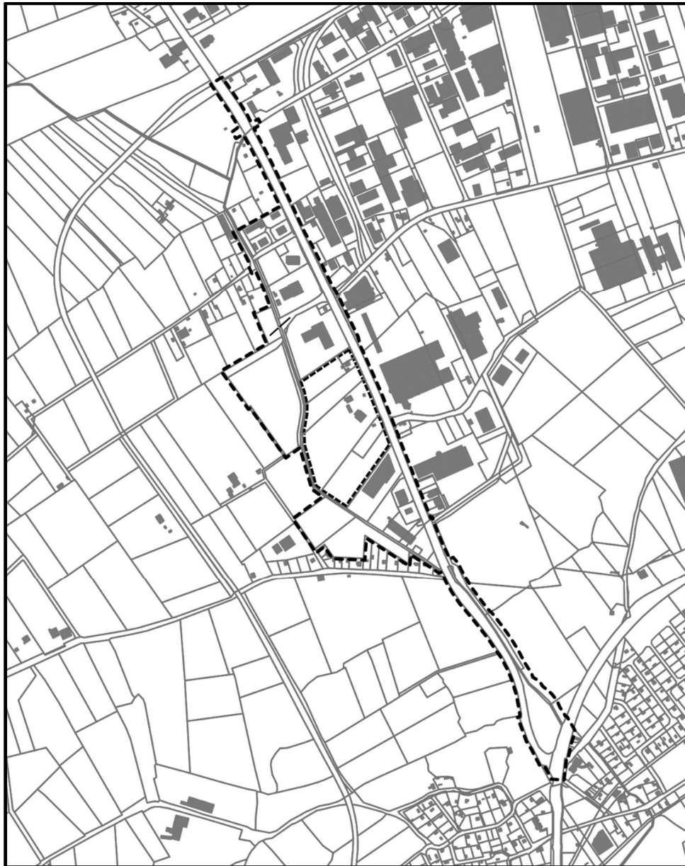
Abbildung 1: Übersichtsplan

Der Geltungsbereich des Bebauungsplanes Nr. 294 liegt im Ortsteil Sandhorst der Stadt Aurich. Die Entfernung zum Stadtzentrum beträgt ca. 3 bis 4 km.